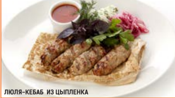
ЛЮЛЯ–КЕБАБ ИЗ ЦЫПЛЕНКА