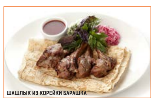
ШАШЛЫК ИЗ КОРЕЙКИ БАРАШКА